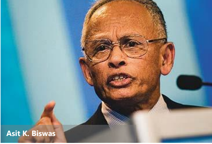
Asit K. Biswas

Ünlü " American Political Science Review "de 1930'larda ve 1940'larda yayımlanan makalelerin yüzde 20'si, politika önerilerine odaklanmaktaydı. Son yapılan sayımda ise bu oran, yüzde 0,3 gibi son derece düşük bir rakama gerilemiş durumda.